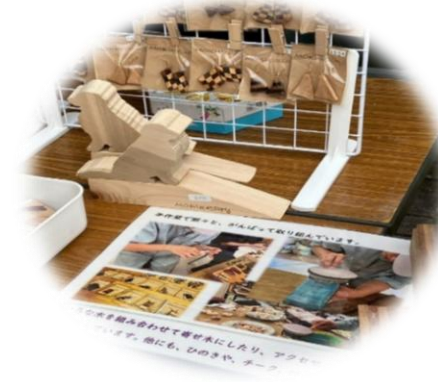
高等部で製作した素敵な作品